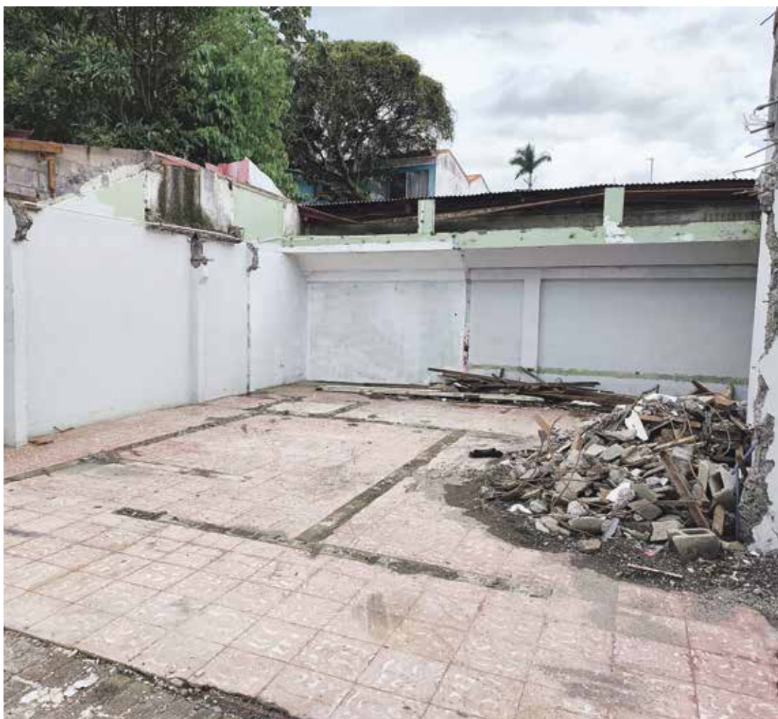
Lugar donde se construirá la Delegación de la Policía Municipal y el centro de monitoreo.

Entre este año y el 2026, la municipalidad espera invertir 145 millones de colones en mejoras a la Plaza Helénica.