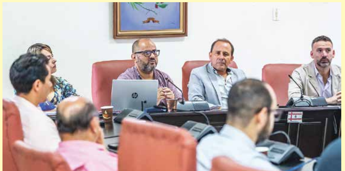
La Federación Occidental de Municipalidades de Alajuela (FEDOMA) recibió en audiencia a la Unión de Gobiernos Locales (UNGL) y a la Federación Metropolitana de Municipalidades de San José (Femetrom).

Las municipalidades de la zona de Occidente buscan soluciones sostenibles y fortalecer la gestión local de residuos sólidos en beneficio de las comunidades.