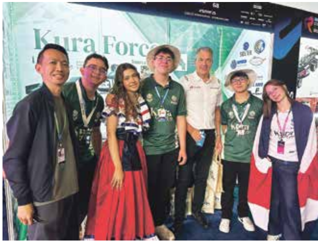
Estudiantes de colegios científicos administrados por la UNED se coronan ganadores del Amaron Sustainability Showcase en la STEM Racing World Finals (SRWF) Singapur 2025.

Sistema Nacional de Colegios Científicos de Costa Rica ha sido nombrado ganador del Amaron Sustainability Showcase en la STEM Racing World Finals (SRWF) Singapur 2025, destacándose por su enfoque innovador en ingeniería sostenible, entre más de 25 equipos internacionales.