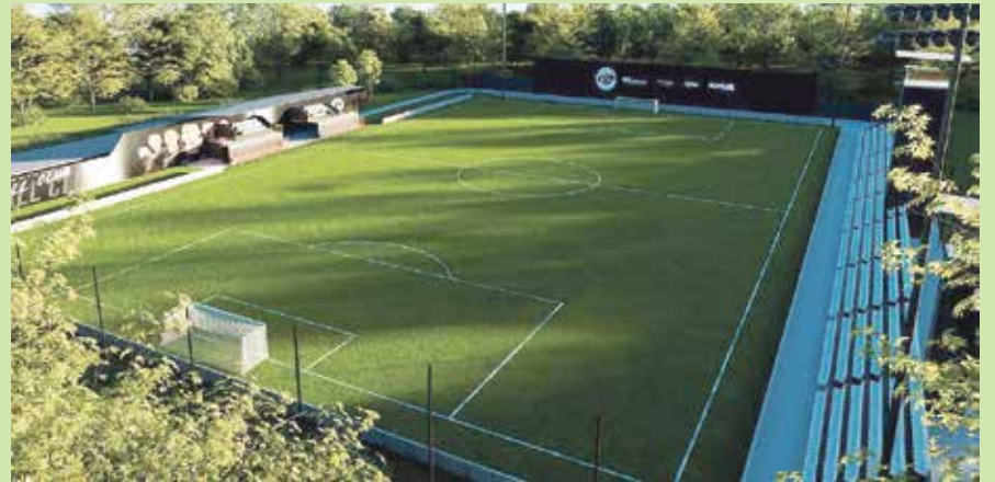
Sporting FC inició la remodelación de la cancha de La Argentina, donde ya cambian la gramilla sintética.

La organización se trasladará con los equipos de Primera División masculino y femenino, futsala, amputados y ya tuvieron contactos con la Asociación Griega de Baloncesto para apoyar el proyecto, además están a cargo del Municipal Grecia en la Liga de Ascenso.