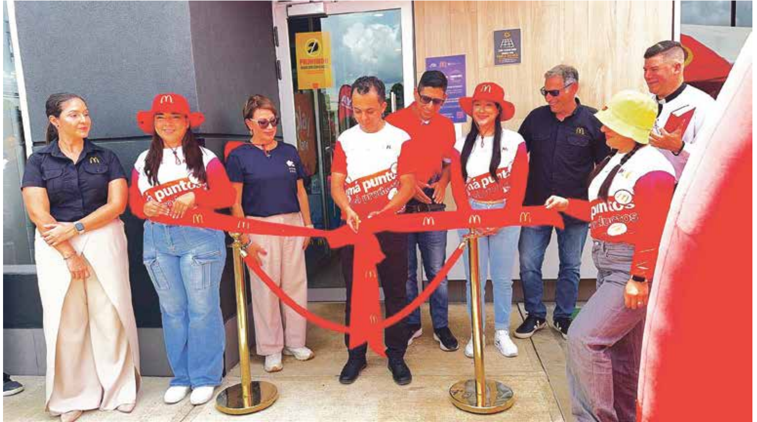
Inauguración de McDonald's Grecia.