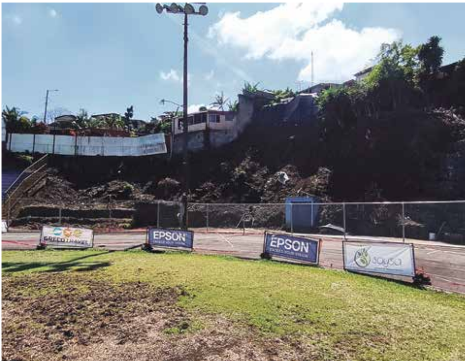
Lugar donde se construirá el muro de gaviones en el estadio Allen Rigioni.