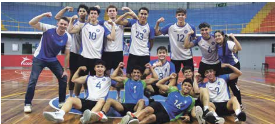
Equipo de voleibol de Grecia.

RODOLFO BOLAÑOS U noticias@periodicomitierra.com