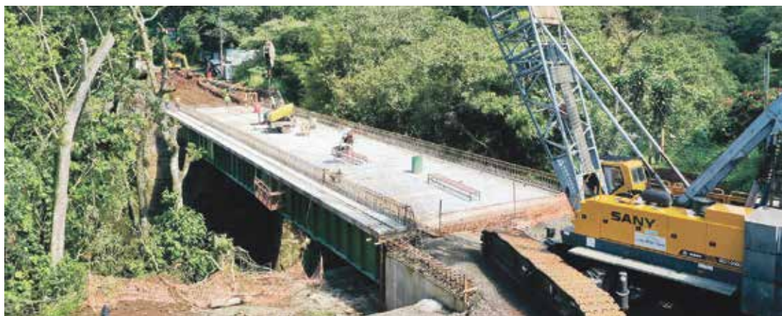
Puente sobre la Ruta Nacional 107, en Poás de Alajuela.

Con un avance del 52% general en el proyecto, quedó debidamente colocada la losa