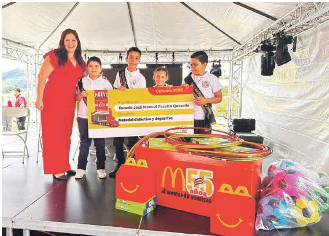
Donación al centro educativo José Manuel Peralta Quesada.

nuestra estrategia socioambiental Receta del Futuro, que busca reducir la huella de carbono de nuestras operaciones y ofrecer a nuestros clientes un restaurante más eficiente y responsable con el medio ambiente", señaló Ureña.