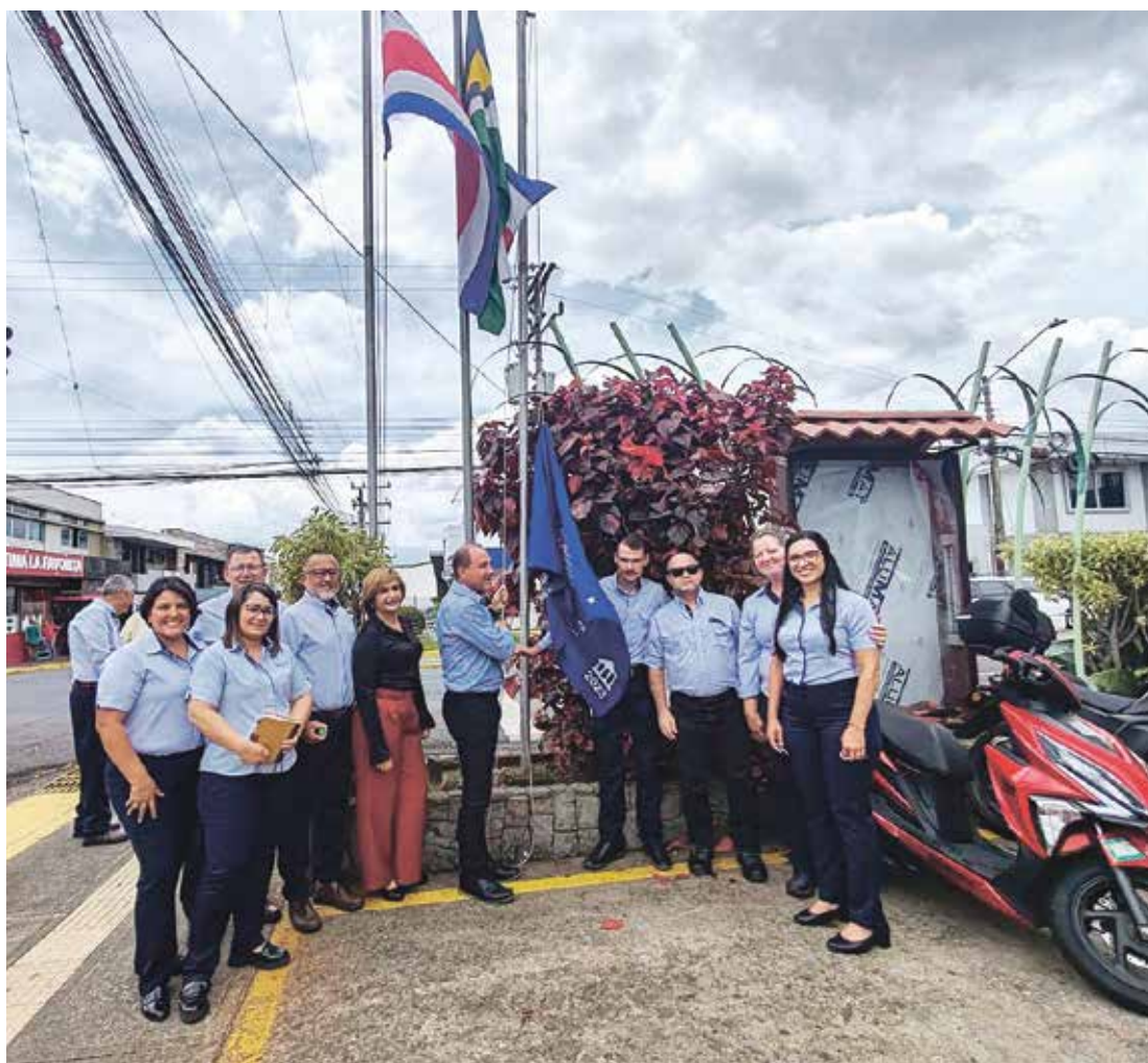
lza de la Bandera Azul en el edificio municipal.

Este galardón se otorga a destinos que cumplen con rigurosos estándares de calidad en gestión ambiental y educación ecológica.