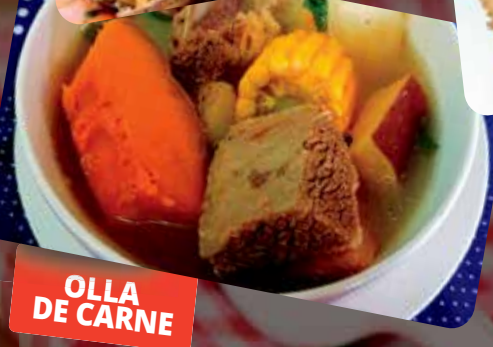
OLLA DE CARNE