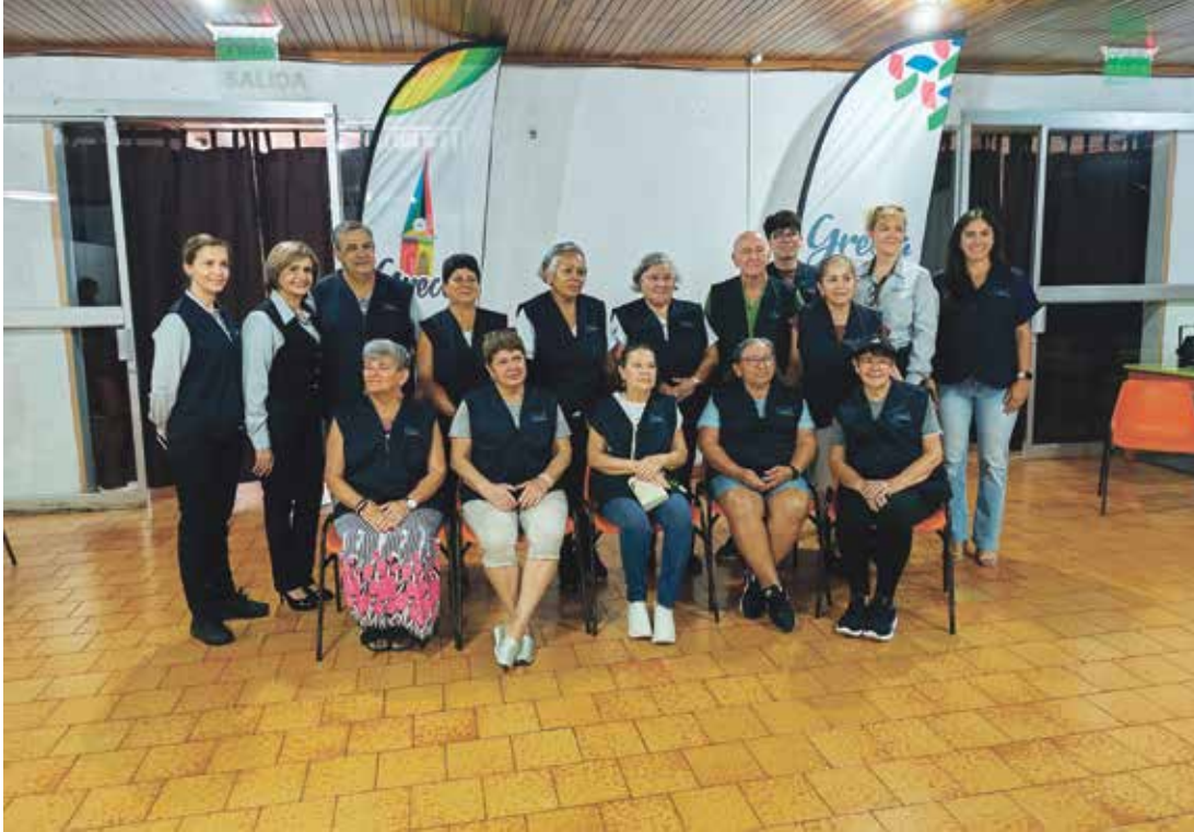
Autoridades municipales junto al Comité de Adulto Mayor.