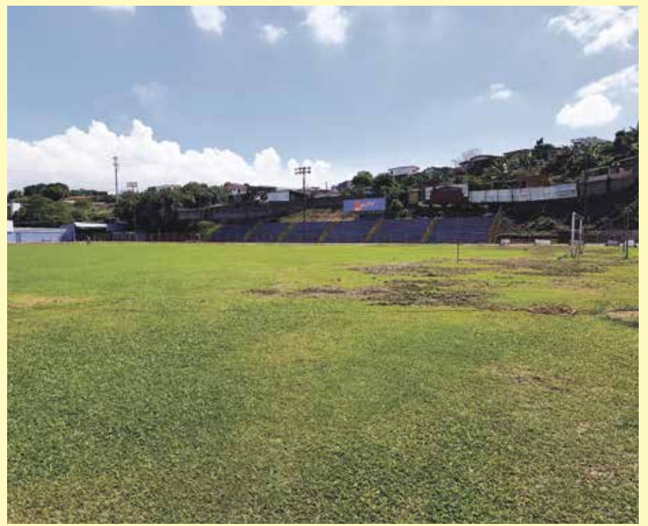
Estadio Allen Rigioni.

La municipalidad también está trabajando en la rehabilitación de la grama de la cancha de fútbol, para tenerla lista el próximo año.