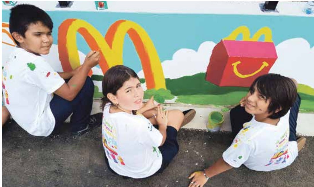
Mural hace un llamado al reciclaje y al uso eficiente de los recursos.